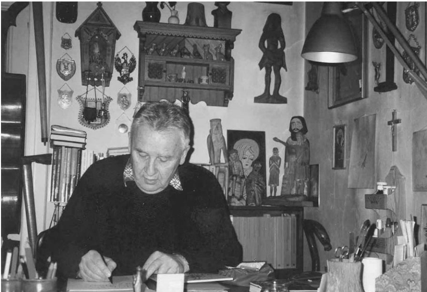
Henryk Górecki, 1997